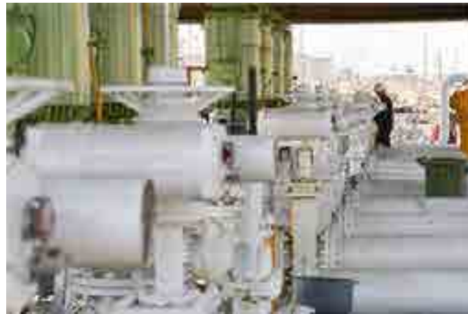
معاون عملیات منطقه شمال با اشاره به افزایش ۳۹ درصدی حجم فرآورده های نفتی تحویلی به انبار پخش مازندران در مقایسه با پارسال افزود: این حجم از فرآورده های نفتی به وسیله ۲۸۴ کیلومتر خط لوله ۱۶ و ۱۲ اینچ ری - ساری به مازندران انتقال یافت و تحویل انبار پخش منطقه ساری شد.